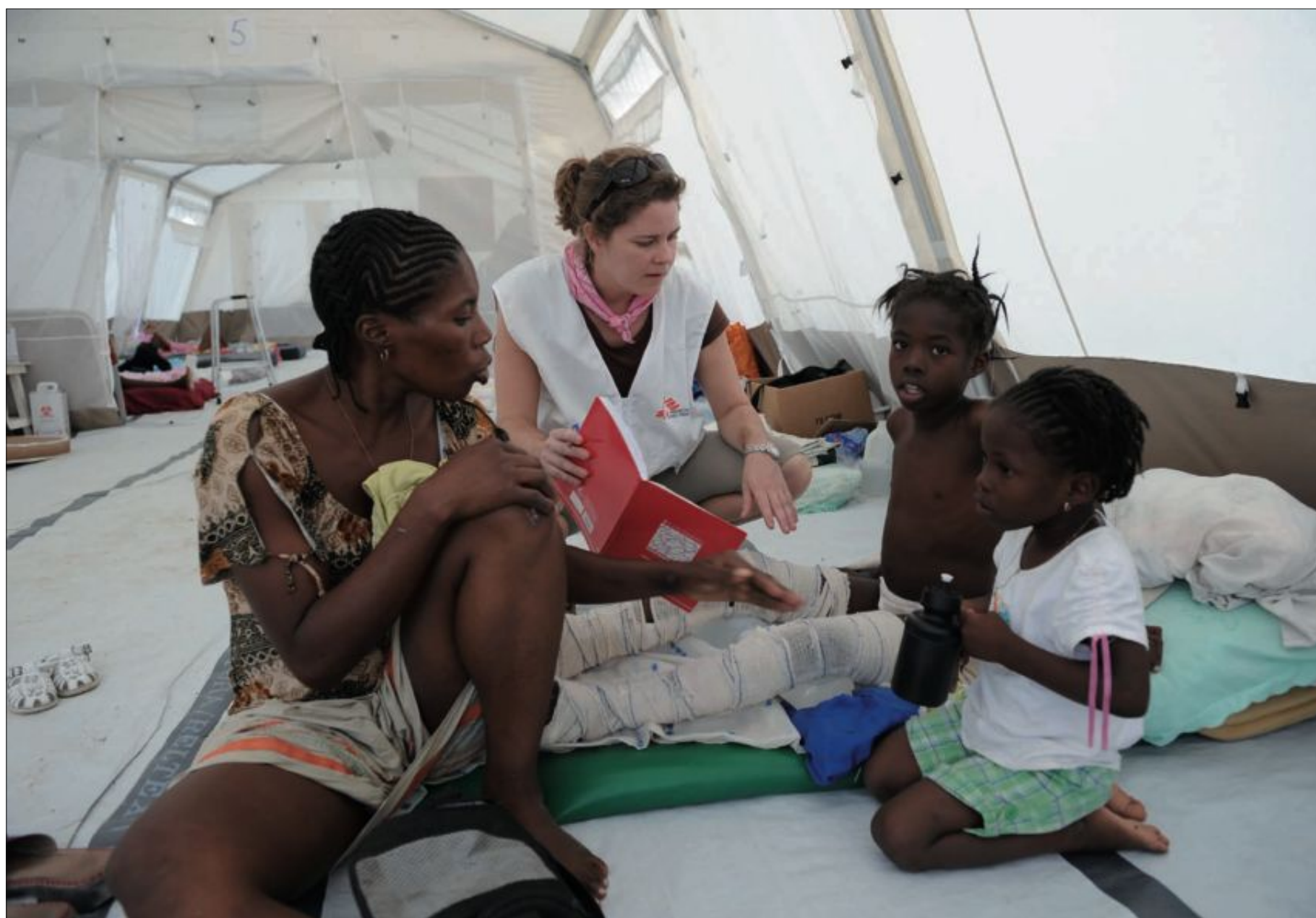
Hjälporganisation. Läkare utan gränser i Sverige har samlat in drygt 38 miljoner kronor till Haiti. Hela organisationen har samlat in 870 miljoner. Den summan räcker till den verksamhet som de bedriver under året som till exempel mödravård, sjukgymnastik och kirurgi.